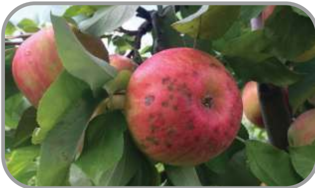
Elmada Kalsiyum Noksanlığı