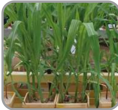
SMART N 28