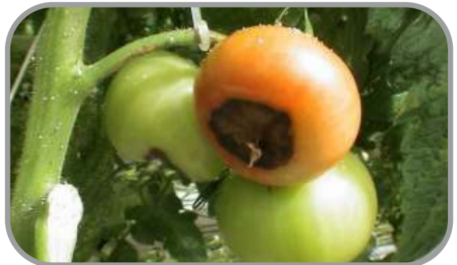
Domateste Kalsiyum Noksanlığı